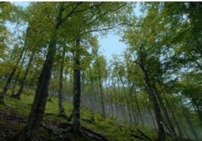
Wolkenwände wabern durch den Wald.

sieht schon ziemlich geschafft aus, dabei liegen noch nicht mal zwanzig Prozent hinter uns – der Rucksack ist halt das A und O. Mehrere Minuten fummeln wir an seinem Gepäck herum; niemand kommt vorbei, niemand ist zu sehen. Wo sind die denn alle? Es müssten doch etwa dreihundert Menschen auf dem Weg nach Roncesvalles sein. Regen und Wolken haben wohl alle Pilger verschluckt. Wie praktisch! Man bewegt sich quasi im Stau über die Pilgerautobahn und hat trotzdem das Gefühl, ganz alleine zu sein.