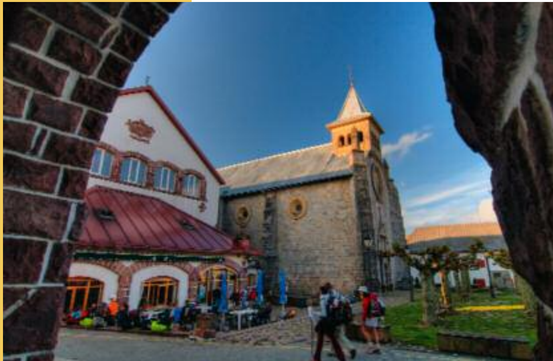
Frühstück in Burguete

Meinen »Anfängerfehler« muss ich mit kostbaren Minuten Schlaf bezahlen. Keine Ohrstöpsel eingesetzt! Man glaubt ja gar nicht, wie viel Krach so ein Vierzig-Liter-Rucksack machen kann, wenn der erst mal gepackt wird. Morgens um 5.30 Uhr! Obwohl die Pforte nach draußen (auf der Rennbahn nennt man sie Startklappen) erst um sechs Uhr geöffnet wird, was bedeutet, dass vorher eh keiner hinauskommt. Und das hat durchaus seinen Grund: Man möchte damit nämlich vermeiden, dass Pilger zu früh aufstehen, anfangen am Rucksack rumzukramen und so womöglich die anderen wecken. Wer also um 5.30 Uhr aufsteht, bekommt die Chance, sich jetzt dreißig Minuten lang so geräuschlos zu verhalten, dass um sechs Uhr garantiert neunzig Prozent aller Betten quietschen und schaukeln.