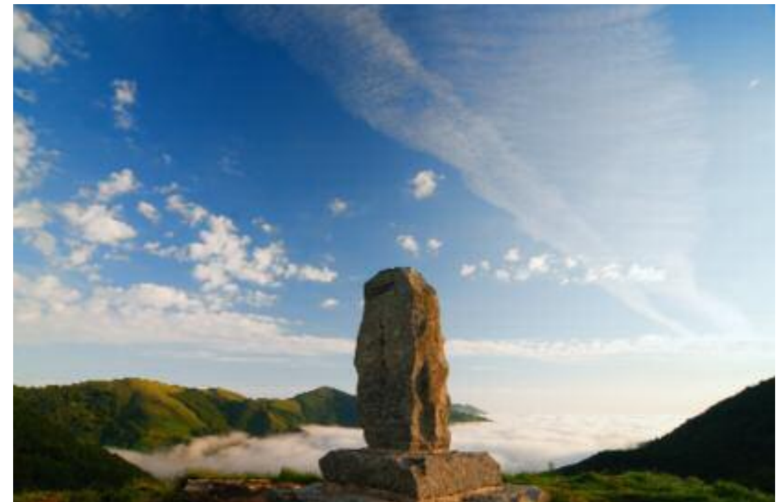
Rolandsstein am Ibañeta-Pass