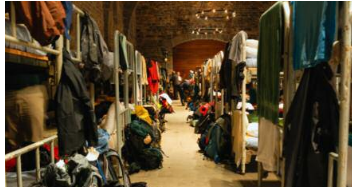
Die Pilgerherberge in Roncesvalles

Saint-Jean-Pied-de-Port: Privatherberge eines holländischen Paares L'Esprit du Chemin, Rue de la Citadelle 40, Tel. 055937/2468 (Reservierung möglich), 18 Plätze, geöffnet April-September, keine Küche, Mahlzeiten; Orisson: Privatherberge noch auf der französischen Seite, Tel. 681/ 497956,