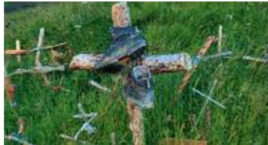
Das erste Kreuz am Ibaneta-Pass wurde angeblich schon von Karl dem Großen für den gefallenen Roland errichtet.