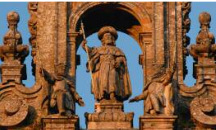
Jakobus in seiner Darstellung als frommer Pilger

Herbergen, »Albergues de Peregrinos«: Existieren bereits zahlreich, und es werden immer mehr. Trotzdem muss über die Sommermonate mit Notlagern improvisiert werden, weil der Camino dann überlaufen ist. Die meisten Pilger steigen erst in Sarria ein, da es ihnen prinzipiell genügt, die letzten hundert Kilometer anhand der Stempel in der »Credencial« zu dokumentieren, um als »Compostelaverdächtig« zu gelten. Die »Credencial« ist der Nachfolger des mittelalterlichen Begleitschreibens oder Empfehlungsbriefes, den der Pilger als Ausweisdokument dabei haben musste. Sonst wurden ihm die Türen nicht so leicht geöffnet. Deshalb ist der Streckenabschnitt durch Galizien besonders stark frequentiert. Viele Herbergen befinden sich in