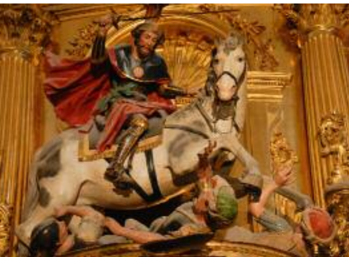
Jakobus als schwertschwingender »Matamoros«, der Maurentöter

Ein leichter Schlafsack ist Pflicht, eine Isomatte nur im Sommer mitnehmen. Bei Taschenlampen auf eine kleine LED-Lampe zurückgreifen.