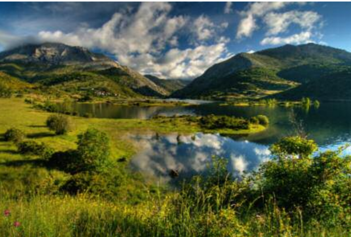
Stausee im Kantabrischen Küstengebirge

endet war, sondern erst, wenn man auch den kompletten Rückweg gemeistert hatte. Ähnlich wie Bergsteiger es ausdrücken: »Der Berg gehört dir erst, wenn du heil wieder unten angekommen bist. Vorher gehörst du dem Berg.« Manche blieben auch freiwillig, fanden einen Lebenspartner, bauten sich eine neue Existenz auf. Viele neue Ideen wurden über die großen Pilgerstraßen nach Rom, Jerusalem und Santiago von den Menschen transportiert worden, und nirgendwo sonst hat sich Europa in früherer Zeit stärker vermischt, als entlang der Pilgerwege. »Jeder geht seinen Weg!«, ist eine Aussage, die man heutzutage in den Wochen auf dem »Camino de Santiago« sicherlich öfter hören wird. Meist als Schlusswort, wenn zwei sich über ihre Erlebnisse ausgetauscht haben und feststellen, dass alle zwar dieselbe Strecke gehen und auch fast dasselbe sehen, aber es doch ganz unterschiedlich aufnehmen und für sich verarbeiten. Persönliche Stimmung, das Wetter, die Jahreszeit, eventuell die Begleitung spielen hier mit hinein. Dass dabei