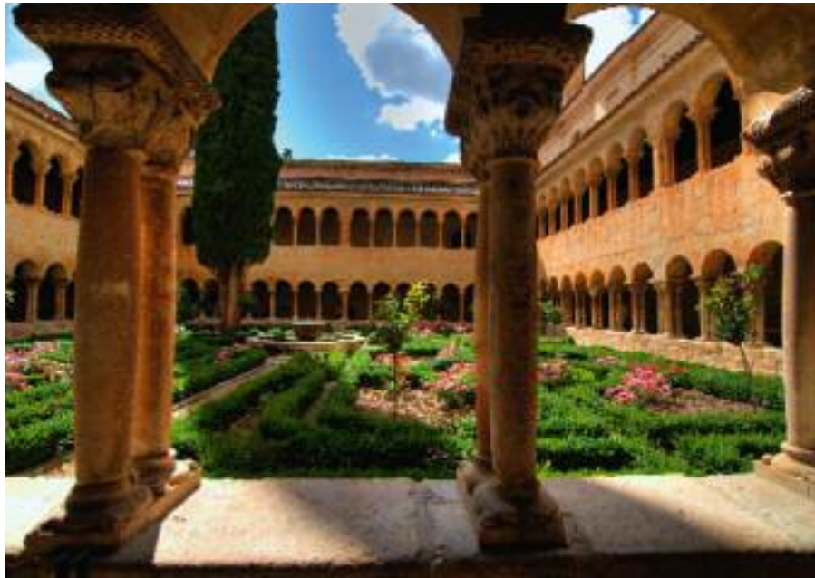
Der romanische Kreuzgang von Santo Domingo de Silos – eine Augenweide