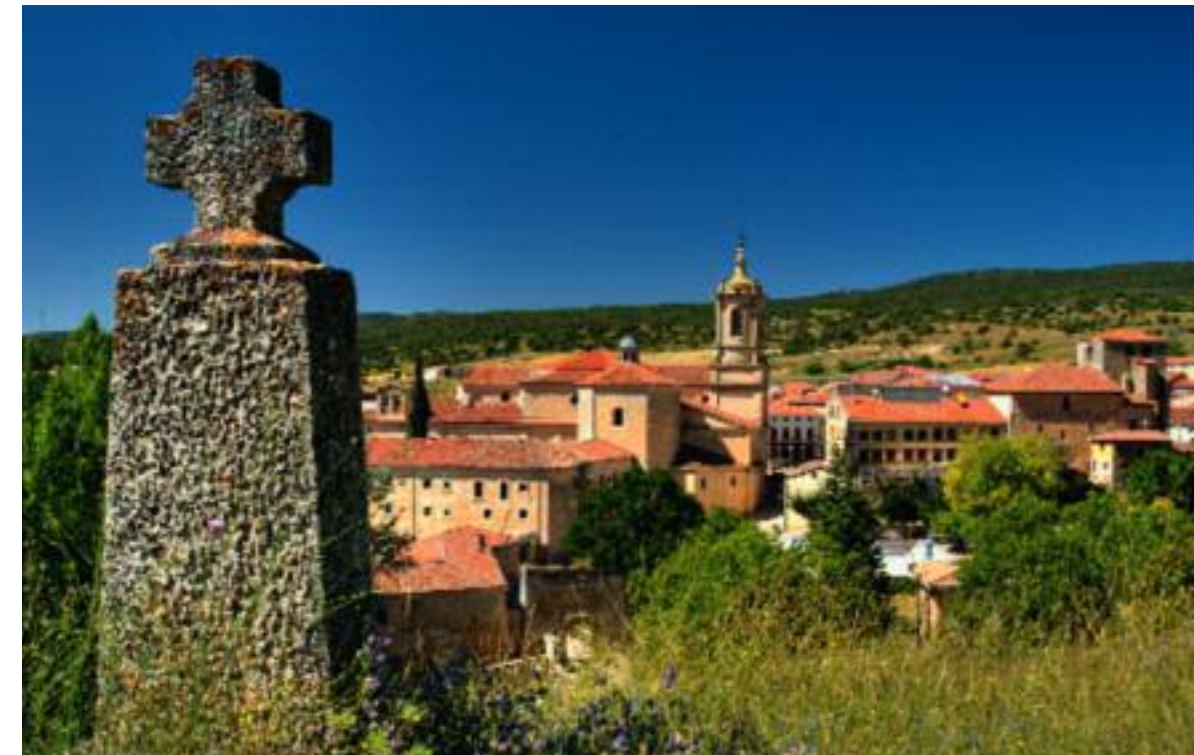
Der Umweg nach Santo Domingo de Silos lohnt sich.

Transport: Wer mal einen Tag ohne Rucksack gehen möchte oder muss: Es gibt Taxi-Unternehmen, die die Rucksäcke von einer Herberge zur nächsten fahren. Über die entsprechenden Telefonnummern verfügt jede gut sortierte Herberge.