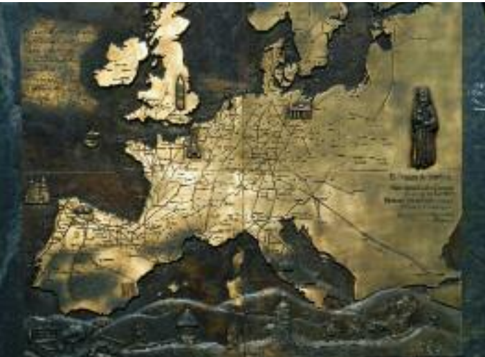
Jakobswege in Europa. Der Stein steht in O Cebreiro.

begangen wird – und deutlich weniger überlaufen ist.