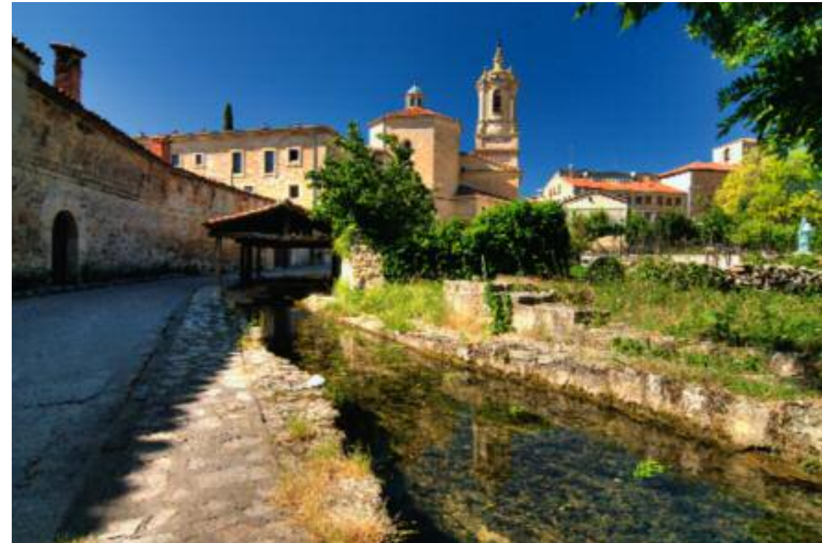
Das Kloster von Santo Domingo de Silos ist einen Besuch wert.

Gerade hatte man erfolgreich die Mauren vertrieben, da betrat Martin Luther im weit entfernten Wittenberg die Bühne. Obwohl selbst