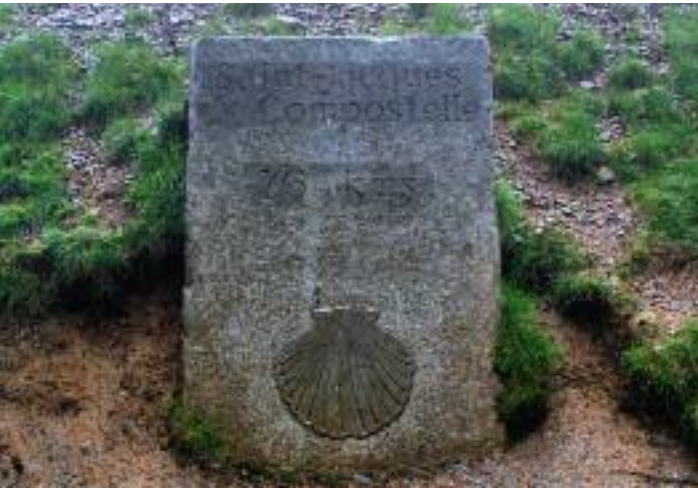
Die Steinplatte beim Rolandsbrunnen – als Motivationshilfe völlig unbrauchbar

stehen auf einer Art Wall, etwa einen Meter höher, und der Camino führt röhrenartig durch den Wald. Der Boden ist komplett mit Laub zugedeckt und der Untergrund vermutlich genauso schlammig wie bisher – wenn man auf das Laub tritt, versinkt man sicher im Morast. Zu diesen Schlussfolgerungen müssen auch meine zwei Biwak-Bekanntschaften gekommen sein. Sie hangeln sich völlig verspannt links oben an den Bäumen entlang, fallen im Schlamm mehrfach auf die Nase und drohen nach rechts in die Rinne zu plumpsen. Das sieht alles sehr nervig aus, denke ich mir. Probier es doch einfach mal auf dem Laubweg. Möglicherweise holst du dir nasse Füße, aber dafür bist du auf gleichmäßigem Untergrund unterwegs. Und siehe da: Es ist überhaupt nicht nass oder matschig. Über einen weichen Teppich renne ich freundlich winkend an den beiden Damen vorbei. Sie brechen in schallendes Gelächter aus und springen auch hinunter in die Rinne. Es ist wie im richtigen Leben: So viel wie möglich selber ausprobieren! Was andere erzählen oder vormachen, kann schlichtweg falsch sein oder zumindest nicht ganz passend. Wenn zwei das Gleiche tun, ist es noch lange nicht dasselbe. Apropos andere: Kein Pilger ist mehr zu sehen. Daher sollten wir die Schrittfrequenz erhöhen, damit wir mal langsam hinunterkommen nach Roncesvalles, zumal mir mittlerweile mein linkes Sprunggelenk Ärger macht. Das war nun überhaupt nicht eingeplant.