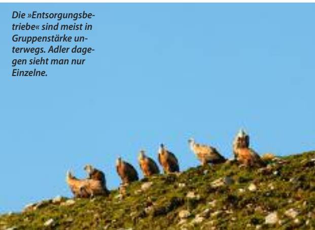
Die »Entsorgungsbetriebe« sind meist in Gruppenstärke unterwegs. Adler dagegen sieht man nur Einzelne.

Mit Rucksack, Fototasche und Stativ marschiere ich vom Campingplatz. Ein weiterer Radfahrer macht sich ebenfalls gerade fertig, der Rest der Pilger schläft noch. Mein Gepäck liegt bei geschätzten zwanzig Kilogramm. Immer noch recht viel, aber ich fühle mich längst nicht mehr als Packesel. Und durch die ver-