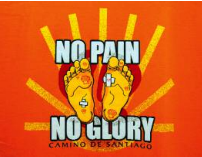
Souvenir aus Santiago de Compostela

Herbergen, »Albergues de Peregrinos«: Existieren bereits zahlreich, und es werden immer mehr. Trotzdem muss über die Sommermonate mit Notlagern improvisiert werden, weil der Camino dann überlaufen ist. Die meisten Pilger steigen erst in Sarria ein, da es ihnen prinzipiell genügt, die letzten hundert Kilometer anhand der Stempel in der »Credencial« zu dokumentieren, um als »Compostelaverdächtig« zu gelten. Die »Credencial« ist der Nachfolger des mittelalterlichen Begleitschreibens oder Empfehlungsbriefes, den der Pilger als Ausweisdokument dabei haben musste. Sonst wurden ihm die Türen nicht so leicht geöffnet. Deshalb ist der Streckenabschnitt durch Galizien besonders stark frequentiert. Viele Herbergen befinden sich in