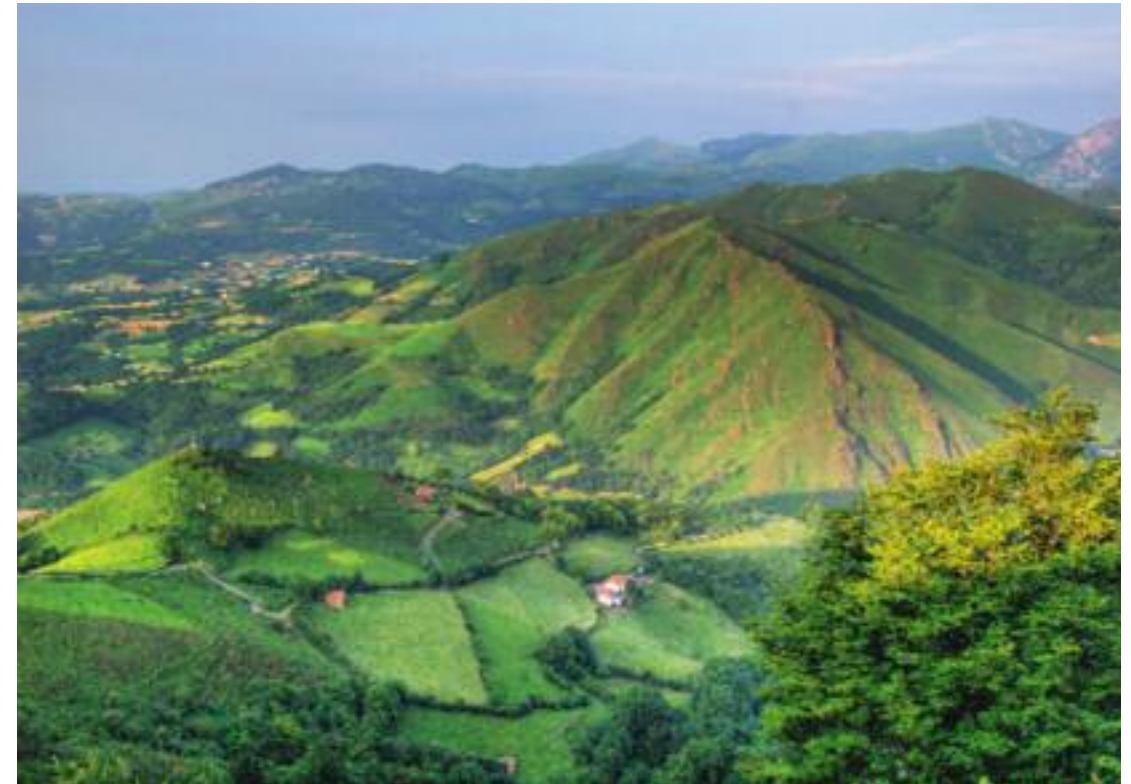
Blick ins Tal kurz hinter Untto

Bald müsste der Abzweig kommen, wo der Weg den Asphalt verlässt. Vor mir irrt eine Ge-