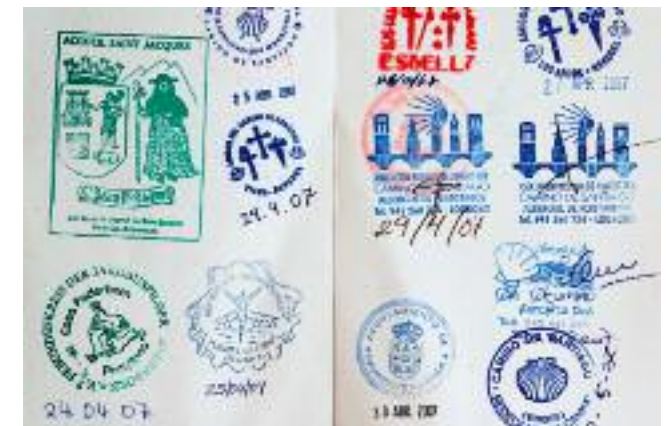
Die »Credencial«, der Pilgerausweis, ersetzt heute das früher nötige Empfehlungsschreiben.

Als Reisezeit favorisiere ich das Frühjahr ab Mitte April bis Mitte Juni. Danach sind große Flächen der Landschaft bereits verbrannt, die Temperaturen deutlich höher und das Pilgeraufkommen theoretisch auch. Allerdings scheint es sich mittlerweile herumgesprochen zu haben, dass im Frühjahr »weniger los ist«, sodass diese Aussage so auch nicht mehr stimmt. Definitiv muss im Frühjahr aber noch mit reichlich schlechtem Wetter gerechnet werden, und durchaus auch mal mit Schnee. Die Monate September und Oktober dagegen bieten meist schönes Wetter, aber das Erlebnis »Meseta in Braun« ist eben nicht das Gleiche »in Grün«, wie es das Frühjahr zu bieten hat.