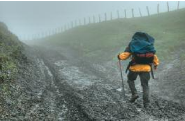
Schlamm Schlacht am französisch – spanischen Grenz- zaun

Ich verlasse St-Jean durch die Port d'Espagne und biege in die Route Napoleon. Wolken ohne Ende, ein leichter Nieselregen fällt. Mal wieder kein Fotowetter. Komme aber die Anstiege gut hoch; mein Puls liegt meist zwischen hundertfünfzig und hundertsechzig Schlägen. Weniger ist in den Pyrenäen wohl nicht machbar. Jage ihn für ein Foto auf hundertdreiundneunzig hoch. Bis ich die Kamera vernünftig ansetzen kann, ist er schon wieder auf hundertfünfundsiebzig abgefallen. So ähnlich muss es wohl beim Biathlon sein. Stoisch mache ich immer wieder mal ein Bild und renne den anderen Pilgern hinterher, denn ganz darf ich den Anschluss nicht verpassen, sonst habe ich bald keine »Models« mehr. Noch vor dem Örtchen Untto laufe ich zu dem Krankenpfleger von gestern auf. Er