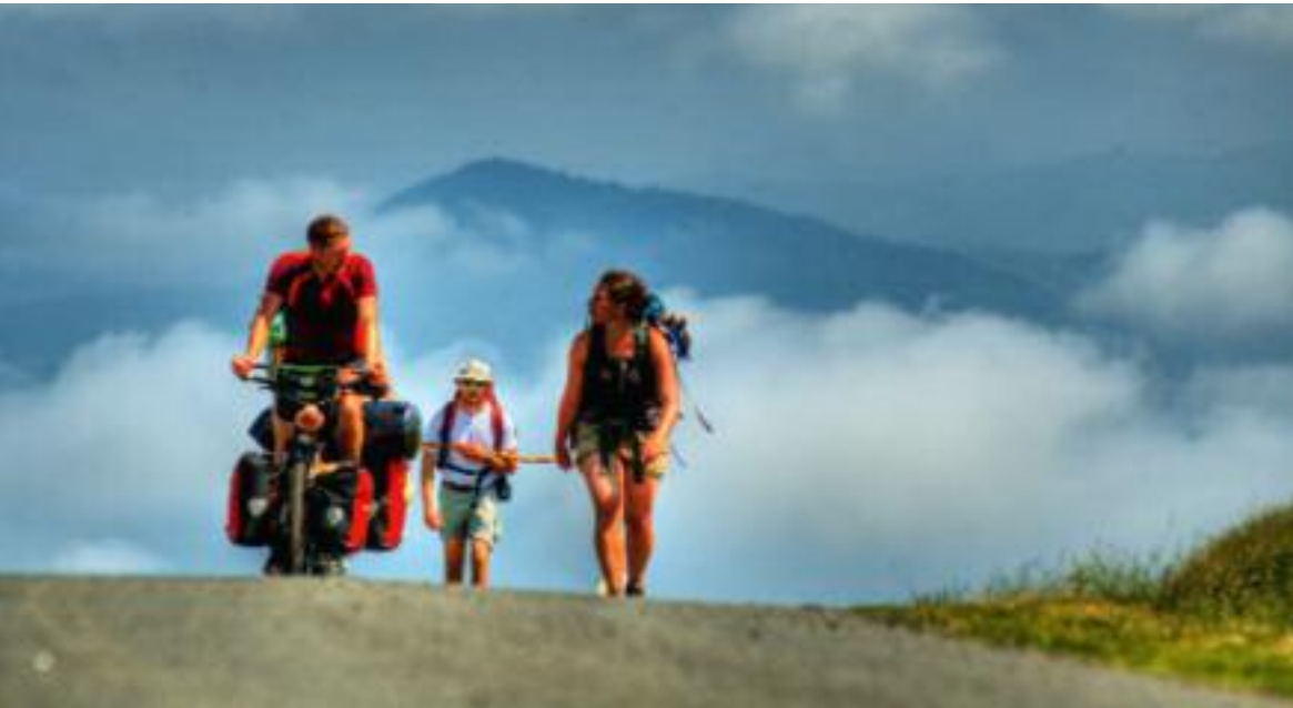
Pyrenäenüberquerung bei schönem Wetter

»Was ich nicht wusste habe ich mir erwandert.« (Alexander v. Humboldt)