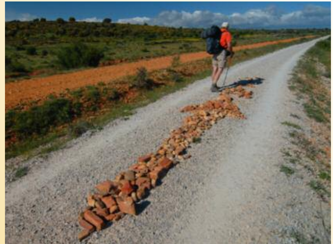
Der Pfeil weist den Weg